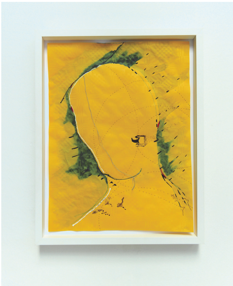
En Mi Mente #21-1, 2023. Mischtechnik auf Tischtuchpapier (Kugelschreiber, Marker, Tinte, Fäden, Acryl) / Mixed media on tablecloth paper (ballpoint pen, marker, ink, threads, acrylic). 60 x 50 cm