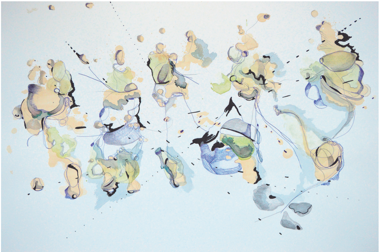
Familia, 2023. Mischtechnik auf Aquarellpapier (Bleistift, Kugelschreiber, Marker, Kaffee) / Mixed media on watercolor paper (pencil, ballpoint pen, marker, coffee). 60 x 50 cm