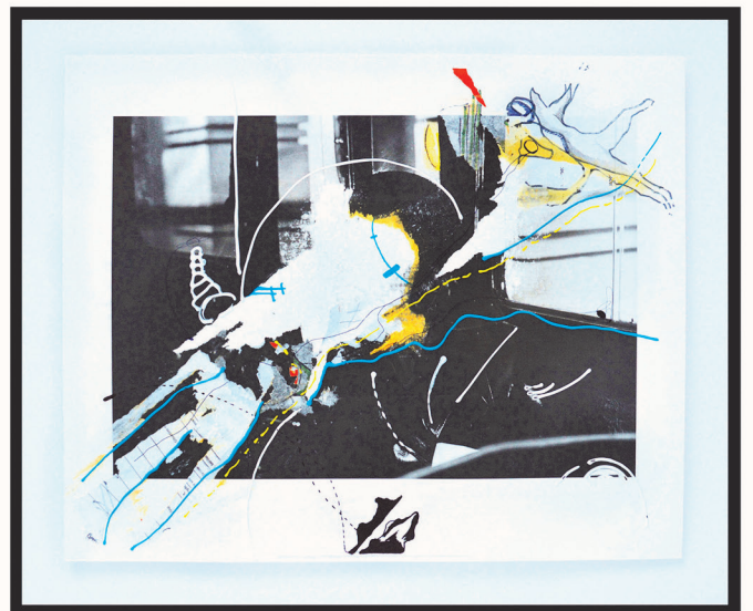
Diasporados, 2023. Mischtechnik auf gefundenem Papier, gerahmt (Mixed media on found paper, framed), 60 x 50 cm ea.