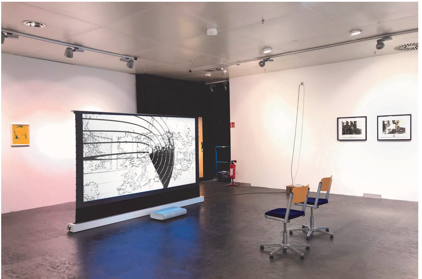
Radar, 2023. Mixed media installation (Video, Stühle, Zeichnungen / Video, Chairs, Drawings). Variable Messungen / Variable measurements. Jupiter First Floor, Hamburg, 2023